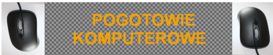
Obraz 1b. Baner z przezroczystością