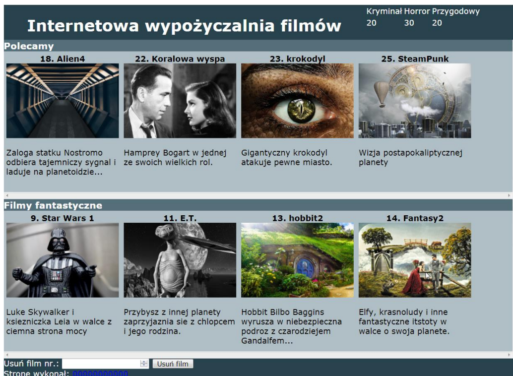
Obraz 2. Witryna internetowa