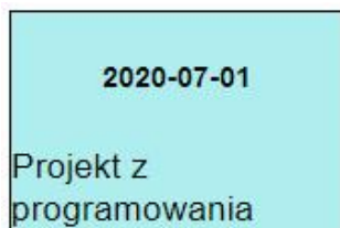
Obraz 3. Pierwszy blok