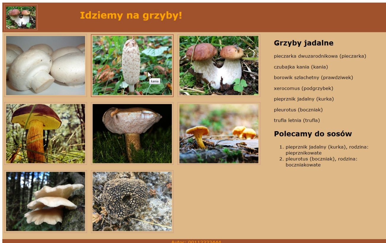
Obraz 2. Witryna internetowa. Cursor został ustawiony na drugim obrazie, zmienił się kolor obramowania oraz został wyświetlony tekst „kania”.