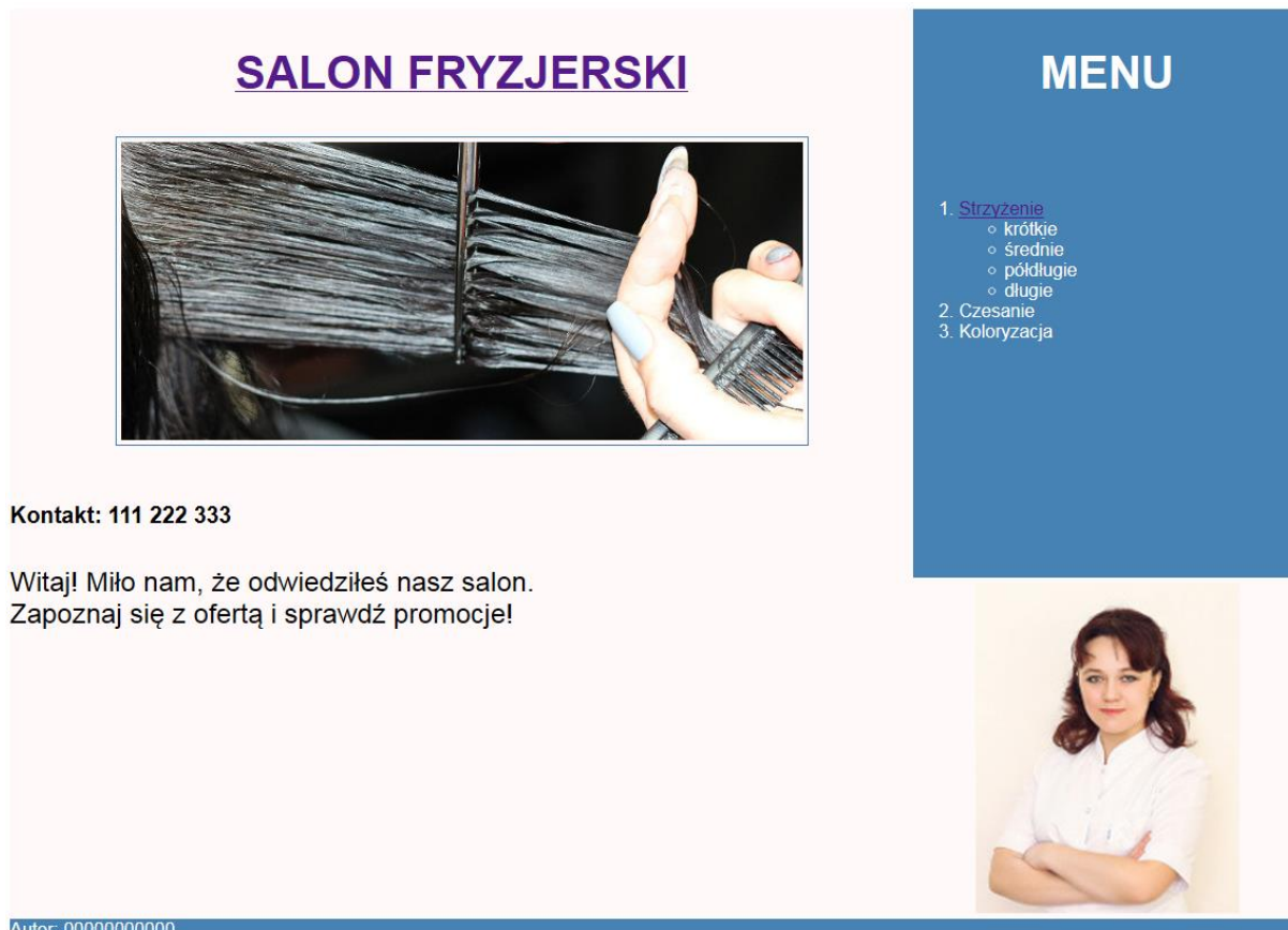
Obraz 2. Witryna internetowa, strona index.html , ramka obrazu pojawia się, gdy kursor znajduje się nad obrazem