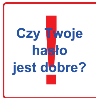
Rysunek 1. Grafika

Witryna internetowa wykorzystuje grafikę, którą należy przygotować. Jest ona zgodna z rysunkiem 1.